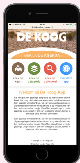
Startscherm van de app

Per actieve vermelding 5 foto's (minimaal 1-2 MB) inclusief omschrijving, NAW-gegevens, navigatie, bellen, mailen en link naar de eigen website. Tarieven zijn inclusief tekstschrijven en vertalen en het plaatsen in de app (Nederlands en Duits).