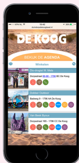
zoekresultaten per rubriek

doen eten en drinken winkelen genieten slapen service wellness en verzorging De Koog by night We love De Koog